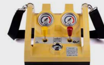
2-fach ALB Totmann-Steuerorgan