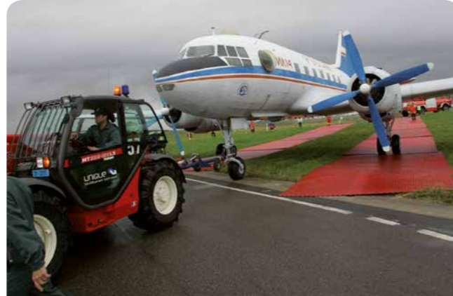
Ein zeitnahe Abtransport ist das Ziel der Bergung