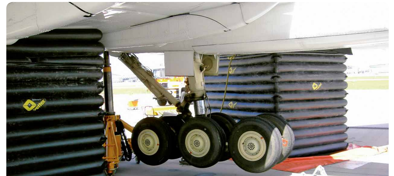
Aircraft Lifting Bags - Sicher und zügig bergen