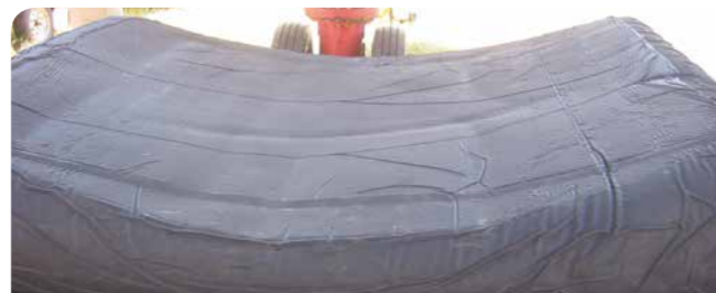
Die perfekte Anpassung vom „Eckigen“ auf das „Runde“