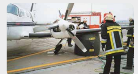
Speziell für kleine Flugzeuge, wie z.B. Cessna entwickelt