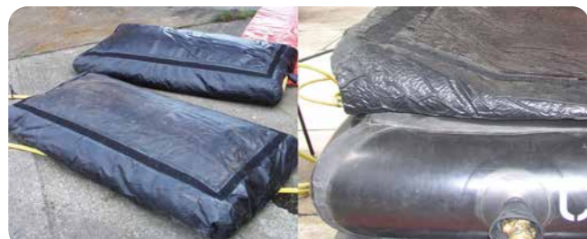
Links: Vorher | Rechts: Nachher, Vakuum gezogen

* Ehemaliger Leiter Flughafenfeuerwehr Frankfurt, Fraport AG