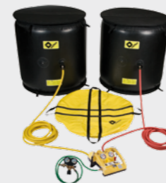
Set ALB 1/23

geringe Gewicht lassen sich diese Hebekissen noch einfacher und sehr schnell handhaben und selbst in schmale Öffnungen zwischen Flugzeug und Untergrund schieben. Sie sind, wie auch die normalen Flugzeughebekissen, zum speziellen Schutz der empfindlichen Strukturen mit Polsterplatten ausgestattet.